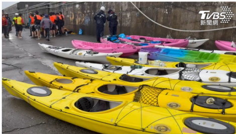
今天天氣不佳造成獨木舟翻覆幾名學生落海，全員均平安上岸。

基隆海洋大學的31名師生今(24)日上午8時左右，在八斗子漁港外海練習獨木舟，因風浪較大，又受海流阻礙導致獨木舟翻覆，