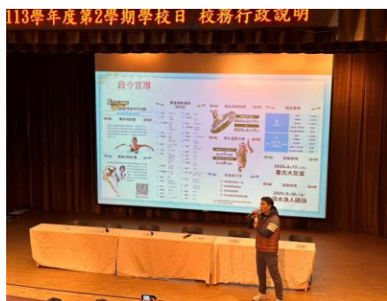
0223 辦理學校日促進親師交流