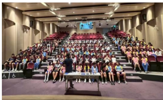
校長與畢業生的約會，感性與理性並存，用關懷與祝福循循善誘。