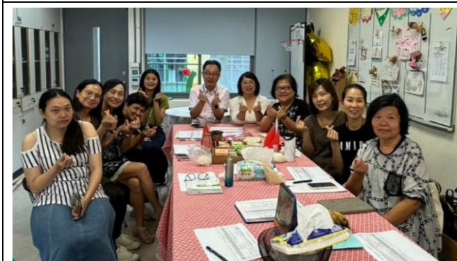
晨輔志工為孩子進行學習輔導。