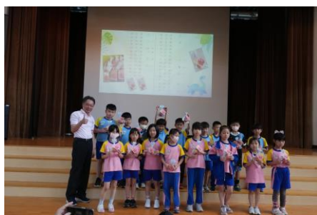
鼓勵學生寫下祝福送給媽媽，感謝照顧自己的親人，表揚投稿的學生-