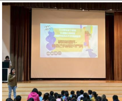
0408 兒朝進行性別教育宣導