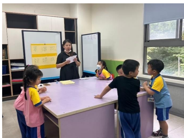
0422 辦理一年級特教闖關活動，指導學生認識各種身心特質