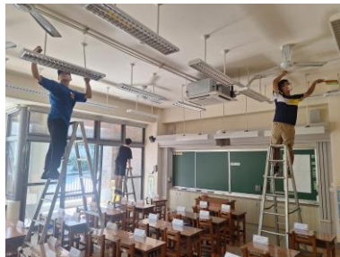
8/22_風扇、燈罩、紗窗清潔