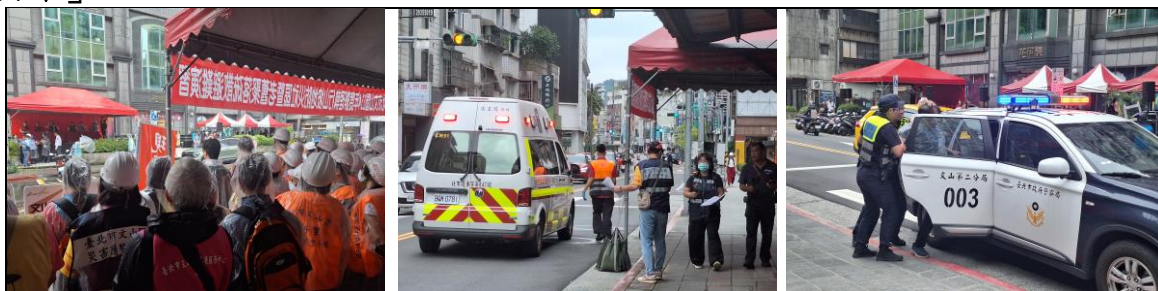
文山區公所主辦，各單位參與