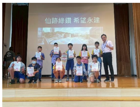
0421 多學班孩子參加天使盃樂樂棒球賽