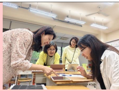
領域小團研習，國際教育研討。