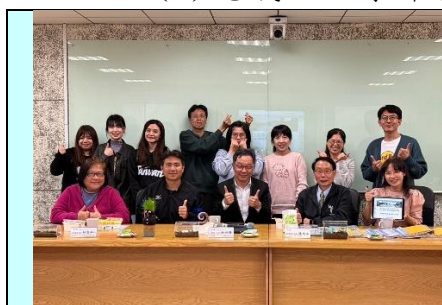
教學輔導計畫，資深帶新手！