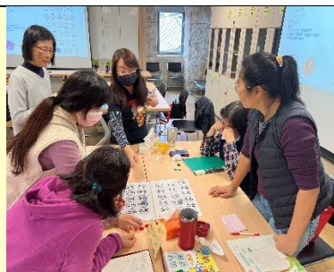
教師專業成長，數學增能。