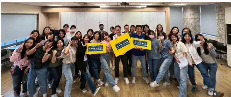
全體老師一同響應 單寧日反性侵活動