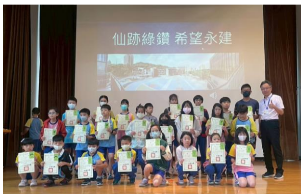
獎勵各班推選愛心小天使