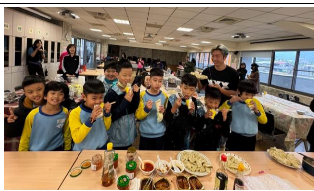
學生一起參與的食農教育活動，聞香而來，食指大動。