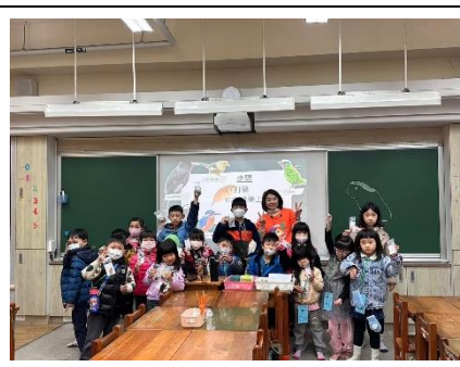
1 月份辦理 Open Day 活動讓社區家長及未入學的孩子走入校園，認識學校。