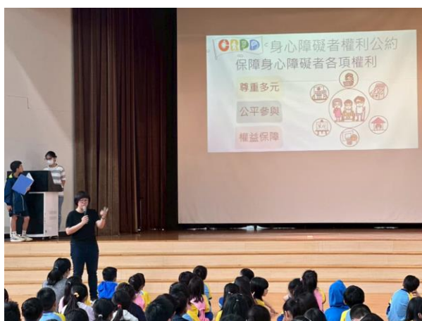
0421 兒朝時間辦理全校特教宣導活動-認識隱性特殊需求