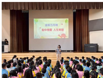
0506 溫馨五月慶祝母親節