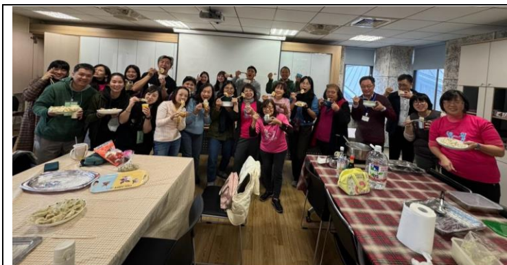
田園食農課程加手工水餃 DIY