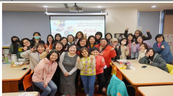
申請愛陪伴專案，圖書志工參與用繪本說故事研習課程，收穫滿滿