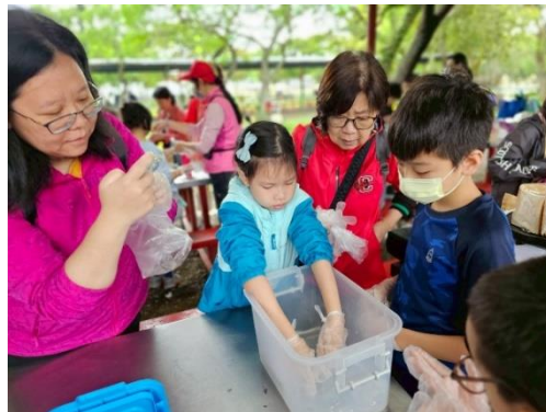
0426 親子共學活動-九斗村農莊生活體驗、生態參訪