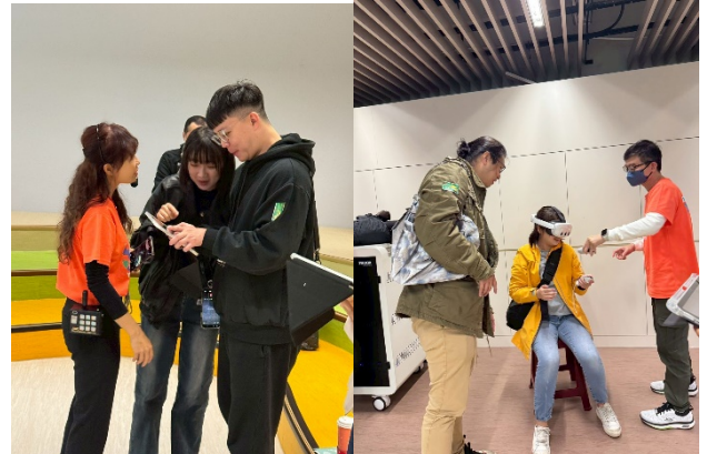
家長也來體驗一下~五年級最新課程-VR 體驗