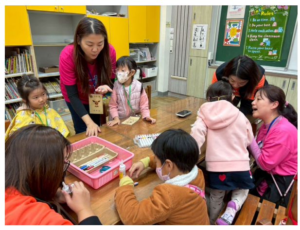
彩繪水黃皮體驗豐富的生態，動手畫一畫