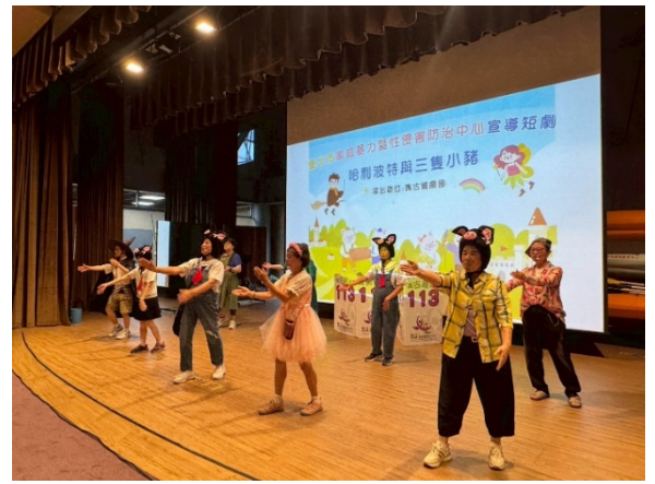
1021 真古錐劇團家暴及性侵害防治宣導