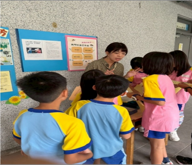
0902 友善校園闖關—情緒管理、性別自主闖關問答