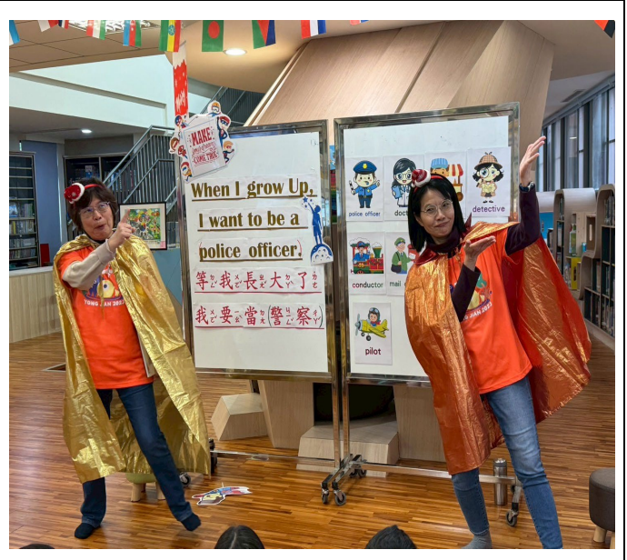
用繪本說故事~跟孩子一起構建未來夢想