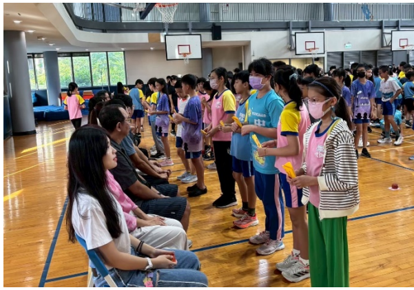
0926 教師節敬師活動引導學生敬師行動