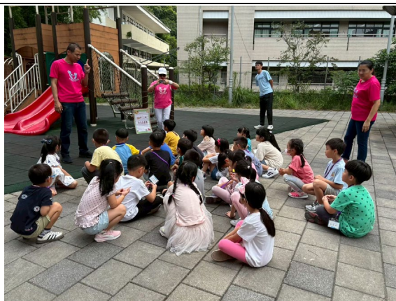
0901 辦理新生始業活動，說故事及闖關、認識校園。