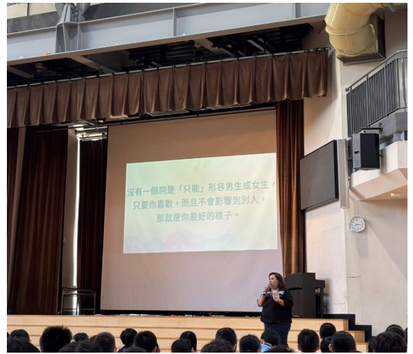
1007 性別平等教育暨小天使信箱宣導