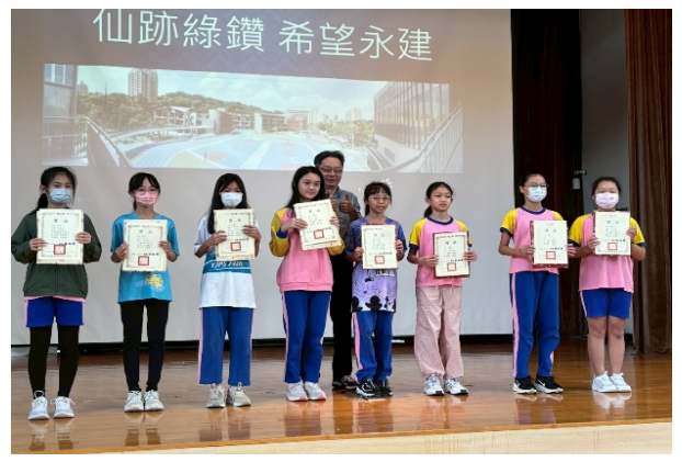
表揚六年級愛心學長姐，感謝他們協助一年級師生，更能融入永建的校園生活。