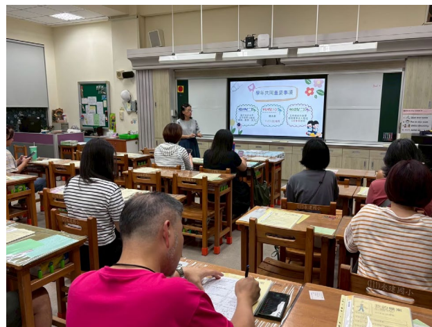
0913 辦理學校日暨班親會鼓勵親師溝通