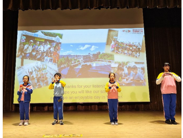
演藝廳裡的英語學校簡介，四位孩子落落大方毫不怯場