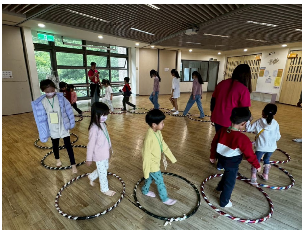
跑跑跳跳動一動，試一試靈活的身手