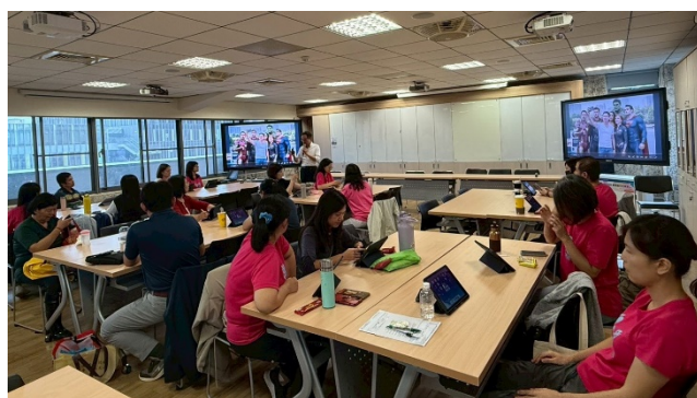
1028 辦理親職數位學習講座推動家長對AI的認識與教養運用