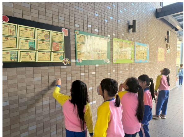
因應永建舊校舍即將拆除改建捷運站，引導學生感恩擁有綠鑽新校區，緬懷永建舊校園，將孩子們的感恩明信片彙集張貼，薰陶飲水思源的感恩情懷。