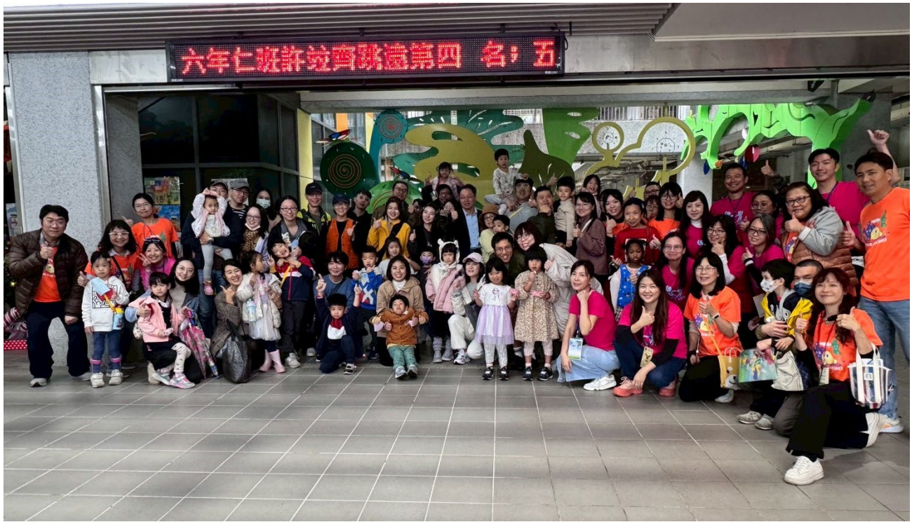
OPEN DAY 親子參訪體驗後留影紀念，家長回饋正向

活動後，校長分享以 Google 表單的回饋意見調查結果，並以 AI 分析的兩幅圖示：