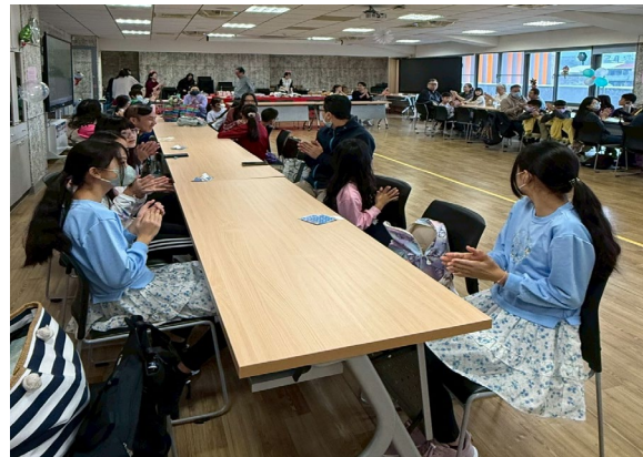
1220 辦理志工感恩餐會，帶著孩子們一起感受年節氣氛

九、114 學年度上學期輔導工作概況(截至 1 月 5 日)--辦理學生心理輔導及教師、家長晤談。