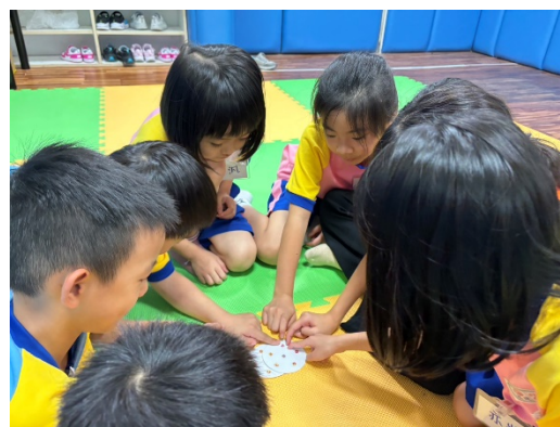
辦理轉入生定向輔導，協助本學期轉入生 12 人認識學校，提供人際支持和適應環境