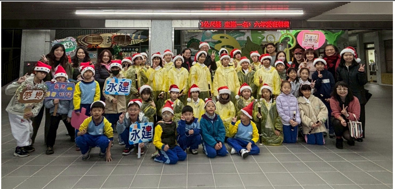
12月辦理永建超人公益行動，引導孩子以感恩的心，關懷需要幫助的失家兒童，推動捐助雲端發票及捐出二手書，挹注忠義育幼院。