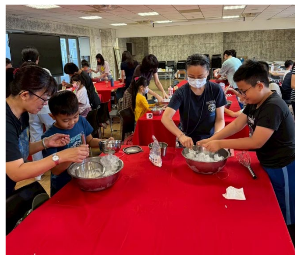
0920 辦理親子共學講座-永續飲食:認識動物福利飲食、冰淇淋手作