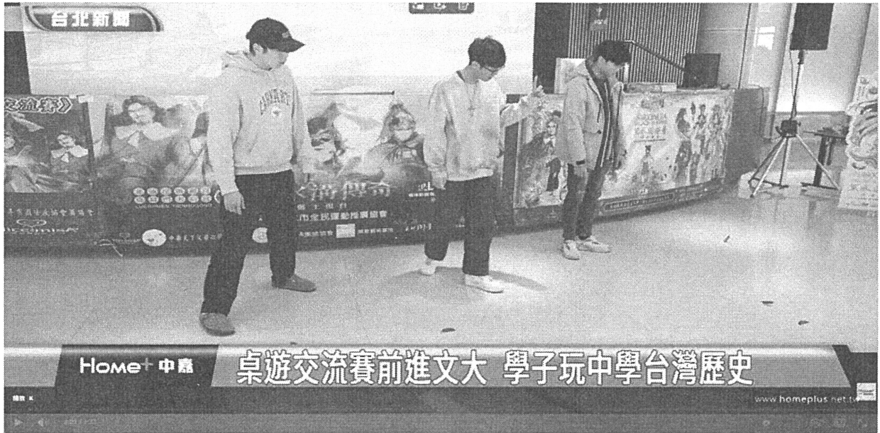
桌遊交流賽前進文大 學子玩中學台灣歷史